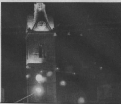
עלימיה אלי אטיאס

מחקר שפרסמה באחרונה עמותת "אדם, טבע ודין" קובע כי בעג'מי, שבה יש 0.6 מ"ר שטחים ציבוריים פתוחים (שצ"פ) לתושב בממוצע, קיימים רק שני גנים ציבוריים ממוזגים בשטח