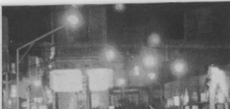
כיכר השעון מתחדשת. מתגאים בעבודה