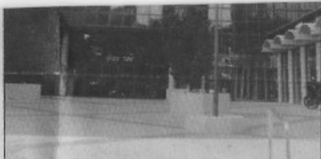
המשלמה ליפו. עירייה יפואית מצליחה

חלק מהאוכלוסיה החל לראות את הדברים כמוכנים מאליהם. לא אני, כי אני יודע שביחס לגודל ההשקעה בהחלפת תשתיות בסמטאות קטנות, ה"הכנסה" לחולדאי במספר קולות בבחירות הקרובות תהיה קטנה, מעצם העובדה שמספר התושבים ברחובות אלו הוא דל. לפני כמה ימים חציתי את עג'מי ברגל בשעת לילה מדרום לצפון, ודרך רחובות העירמון ואבן סינא. לראות את