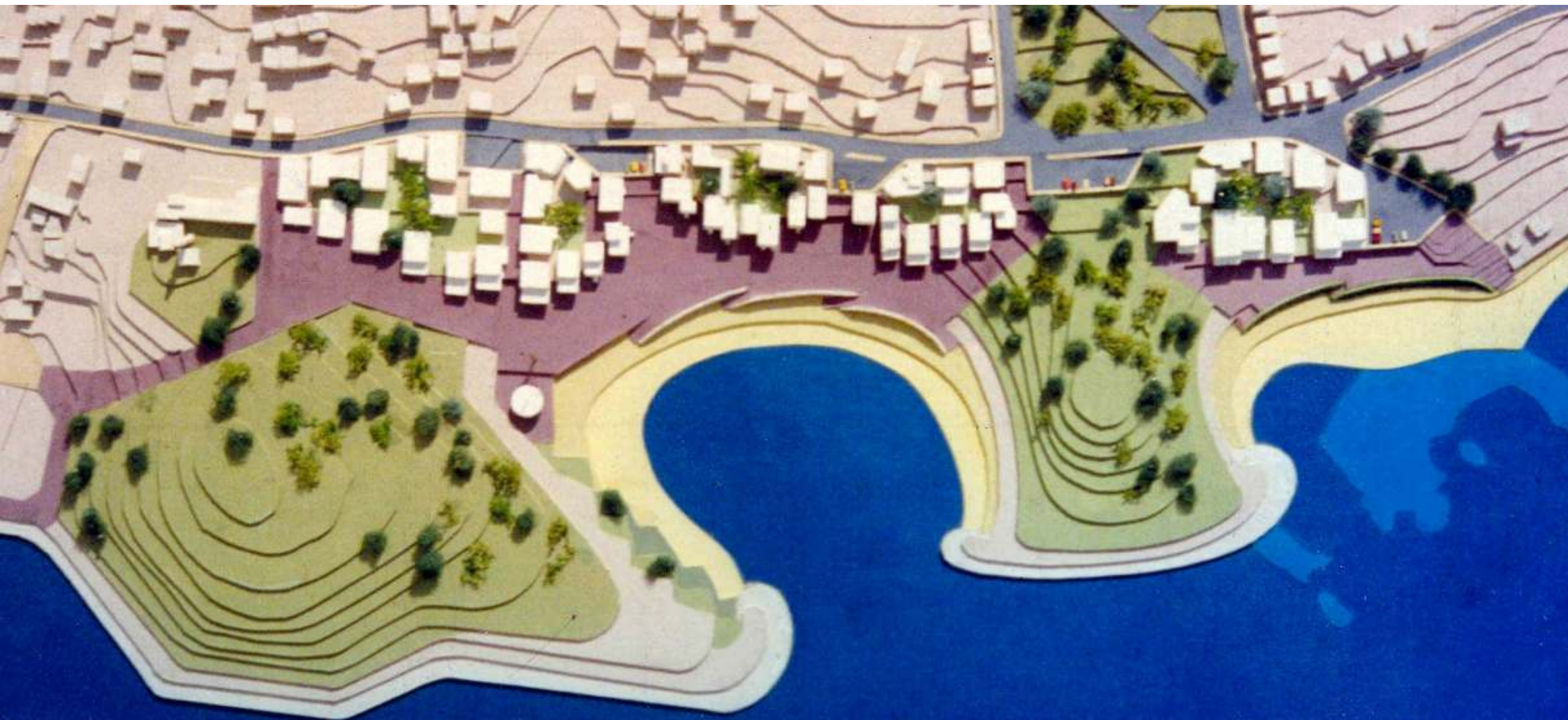
יפו "המפרץ" - מרדכי דוברבסקי - אדריכל ומתכנן ערים